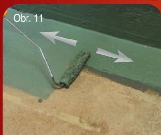
Obr. 11 Nanášení – aplikace / Nanášanie - aplikácia 4/5 Celoplošná aplikace první vrstvy. Celoplošná aplikácia prvej vrstvy.