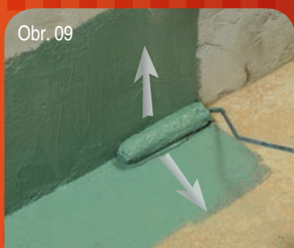
Obr. 09 Nanášení – aplikace / Nanášanie - aplikácia 2/5 Nanést první vrstvu Tekuté lepenky. Naniesť prvú vrstvu Tekutej lepenky.