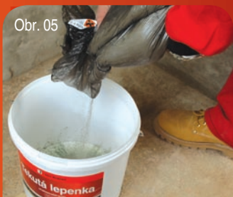
Obr. 05 Příprava směsi / Příprava zmesi 3/5 Vsypání sypké složky do složky tekuté. Vsypanie sypkej zložky do složky tekutej.