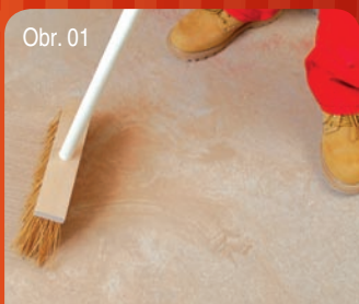
Obr. 01 Příprava podkladu / Příprava podkladu 1/2 Zbavit podklad prachu a volných částic. Zbaviť podklad prachu a volných částic.

HYDROIZOLAČNÍ NÁTĚR / HYDROIZOLAČNÝ NÁTER PRACOVNÍ POSTUP / PRACOVNÝ POSTUP