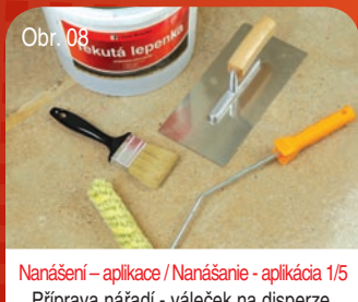
Obr. 08 Nanášení – aplikace / Nanášanie - aplikácia 1/5 Příprava nářadí - váleček na disperze, štetec nebo ocelové hladítko. Priprava náradia - valček na disperzie, štetec alebo ocelové hladítko.