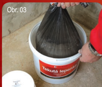
Obr. 03 Příprava směsi / Příprava zmesi 1/5 Vytahnout z balení obě složky, sypkou a tekutou. Vyťahnuť z balenia obe zložky, sypkú a tekutú.