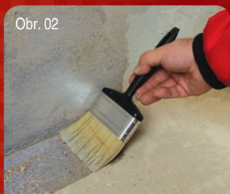
Obr. 02 Příprava podkladu / Příprava podkladu 2/2 Penetrace podkladu, sjednocení savosti. Penetrácia podkladu, zjednotenie savosti.