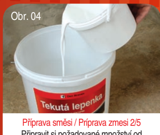
Obr. 04 Příprava směsi / Příprava zmesi 2/5 Připrav si požadované množství od každé složky pro jednotlivé nátery. Priprav si požadované množstvo od každej zložky pre jednotlivé nátery.