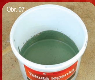
Obr. 07 Příprava směsi / Příprava zmesi 5/5 Důkladná homogenizace obou složek. Dôkladná homogenizácia oboch zložiek.